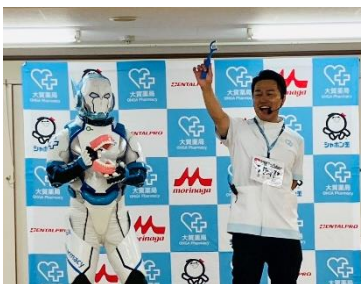
デンタルフロスの使い方