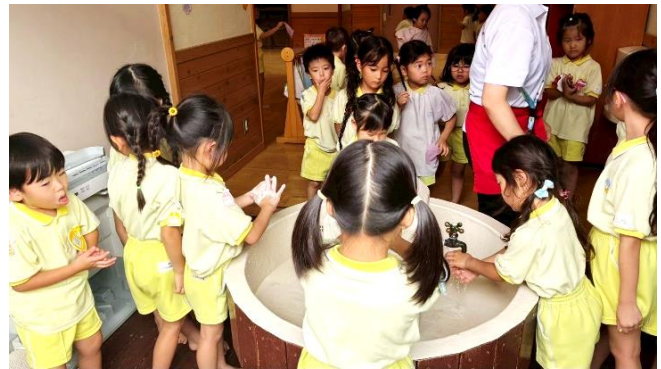
ショーの終了後、手洗い場に行列が！