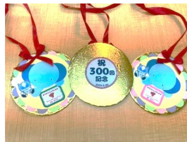
園児からのプレゼント