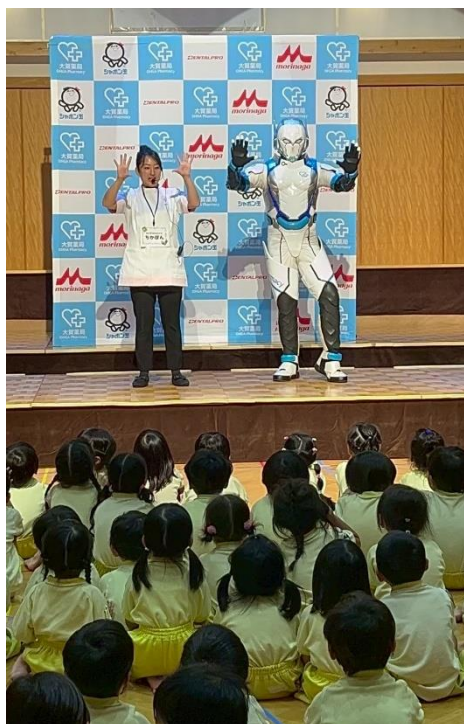
正しい手洗い・うがいショー